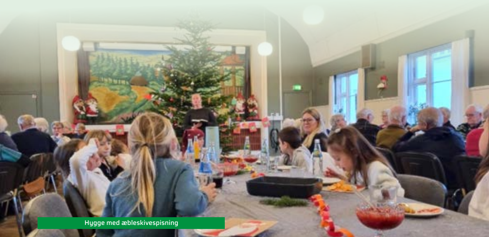
Hygge med æbleskivespisning

Alt i alt en meget stemningsfuld og hyggelig eftermiddag, hvor de værdifulde fællesskaber på tværs af alder blev plejet.