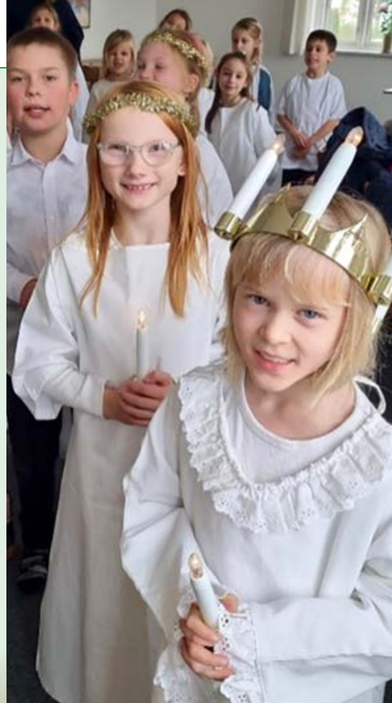
Der gøres klar til at gå Lucia