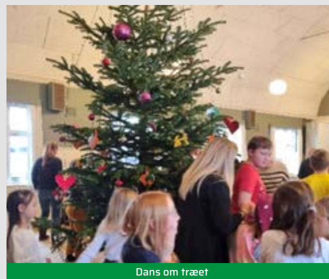
Dans om træet