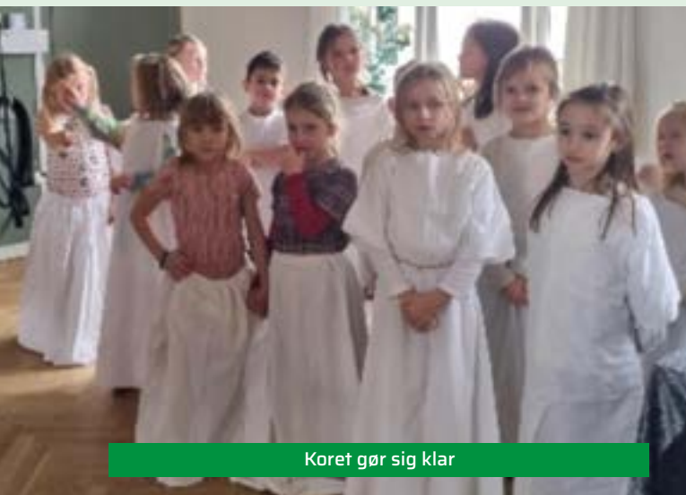
Koret gør sig klar

Torsdag d. 7. december inviterede Danske Seniorer afd. Svanninge til julearrangement med juletræ og Luciaoptog.